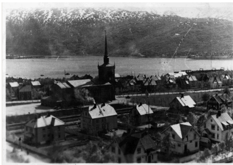
N° 20/ Référence : DG 16-338