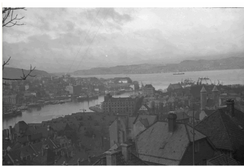
N° 10/ Référence : DAM 45 L17

Le terrain d'aviation de Fornebu dans la banlieue d'Oslo est capturé dans la matinée du 9 avril par des troupes aéroportées allemandes permettant ainsi aux avions de transport Junkers Ju-52 de se poser. Malgré les tirs des batteries norvégiennes, le ravitaillement et les troupes sont débarquées ce qui facilite grandement la prise de la ville.