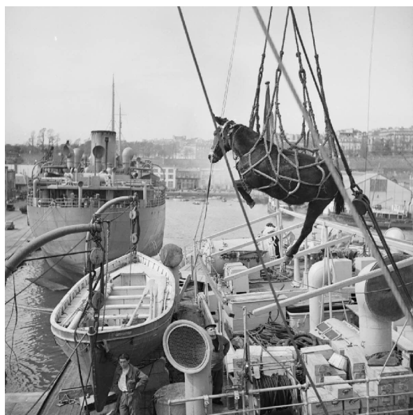
N° 7/ Référence : MARINE 219-3070

Près de 4 000 Polonais participent à la campagne de Norvège au sein du CEFS. Leurs principaux faits d'armes sont de s'être notamment emparés de la presqu'île d'Ankenes et d'avoir nettoyé les collines jusqu'au fond du Beisfjord.