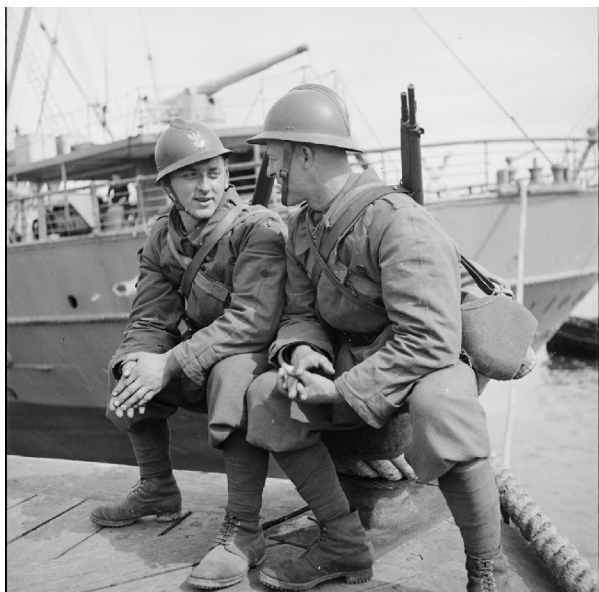
N° 6/ Référence : MARINE 219-3069

Soldats polonais de la BACP intégrée à la 1 re DLCh sur un quai du port de Brest avant leur embarquement à destination de la Norvège.