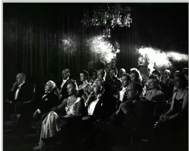
N° 19/ Référence film (photogramme) : SA 12 Time code TC IN : 00 : 04 : 00 A Oslo, présentation à l'ambassade d'Allemagne du film Feuertaufe.