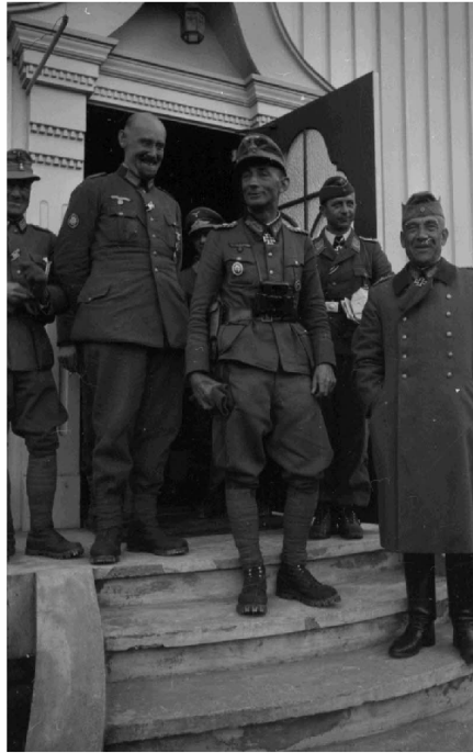
N° 12/ Référence : DAM 90 L20

A Narvik, les 2 000 chasseurs alpins allemands commandés par le général ( Generalleutnant ) Eduard Dietl sont dans une situation difficile en raison du débarquement des 24 000 hommes des forces alliées. De plus, le périmètre défensif alloué aux chasseurs et les conditions météorologiques ne permettent pas l'envoi de renforts. Ainsi, Dietl dut faire appel aux 2 600 marins des destroyers de la Kriegsmarine coulés par les armées norvégiennes et britanniques. Grâce aux armes saisies aux troupes norvégiennes, aux marins et aux chasseurs alpins, Dietl organise la défense.