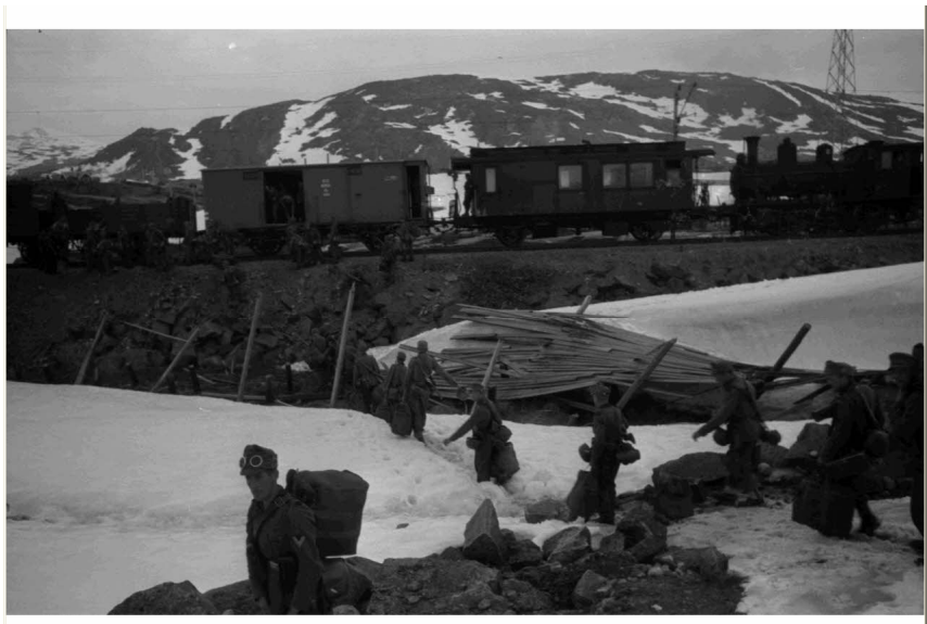
N° 16/ Référence : DAM 94 L24

Après la prise des îles Lofoten, les chasseurs alpins qui y avaient été parachutés rejoignent le continent à bord de train.