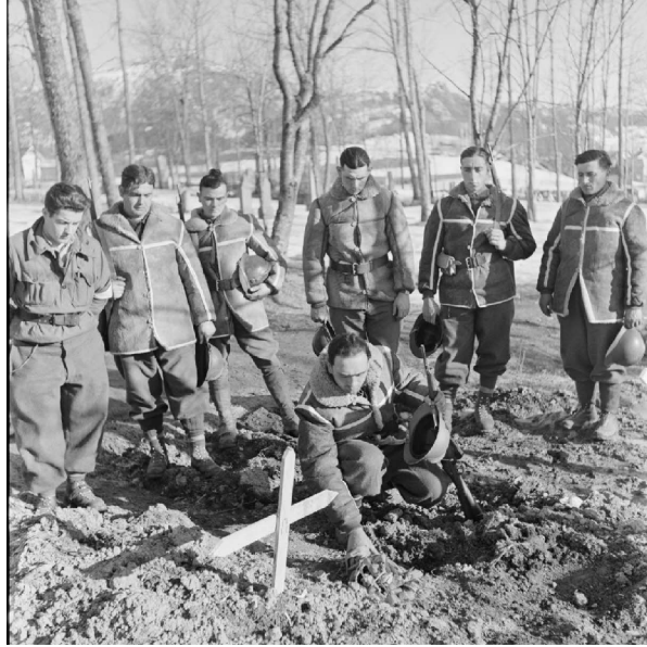
N° 17/ Référence : MARINE 259-3623

Dans le secteur de Namsos, des soldats se recueillent sur les tombes d'hommes tombés pendant les bombardements sur la ville.