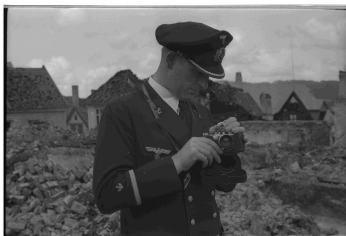
N° 8/ Référence : DAM 545 L15

Tous les navires de la Kriegsmarine disposent à leur bord de reporters.