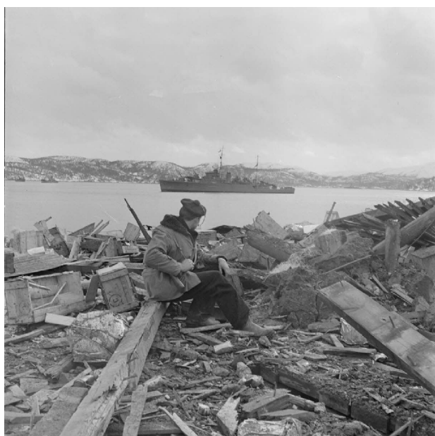
N° 12/ Référence : MARINE 240-3337

Vue de Namsos (Norvège). Au premier plan, un chasseur alpin. Avril 1940, photographe Jean Prevel