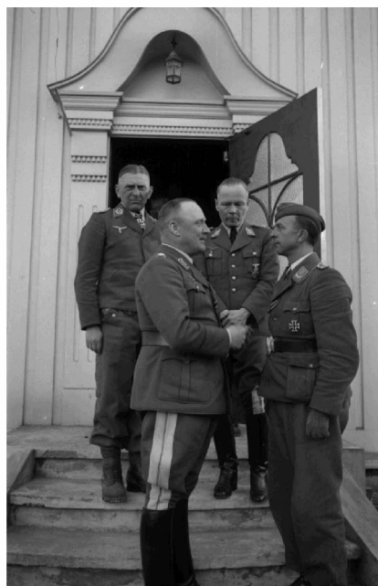
N° 6/ Référence : DAM 90 L04