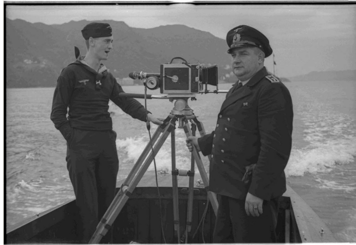
N° 9/ Référence : DAM 545 L15

Une flottille de dragueurs auxiliaires légers de la Hafenschutzflottille de Bergen, du type "Zwerg", quitte le port d'attache pour effectuer une mission de déminage dans un fjord. La flottille est suivie par une équipe cinématographique de la 1 re compagnie de propagande de la Marine allemande (Marine Propaganda Kompanie), embarquée à bord d'un canot à moteur. A bord, l'adjutant (Feldwebel) et cameraman Paul Schmöckel et le caporal (Gefreiter) et assistant cameraman Wolfgang Krimmel.