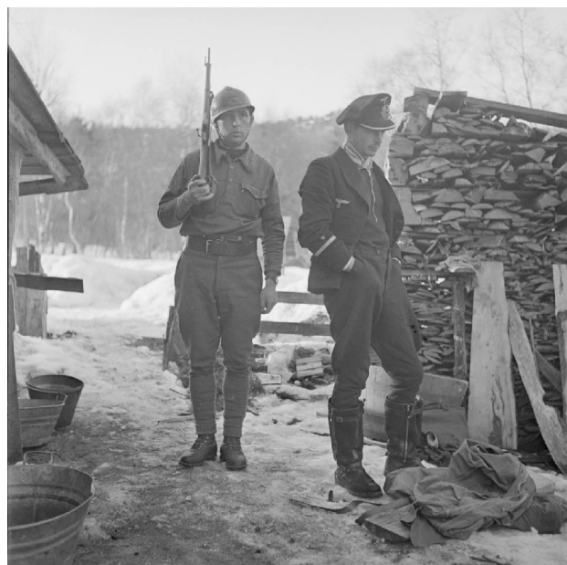
N° 16/ Référence : MARINE 243-3382

Officier allemand de la Kriegsmarine fait prisonnier, gardé par un légionnaire armé d'un mousqueton modèle 92/16 dans le secteur de Namsos (Norvège).