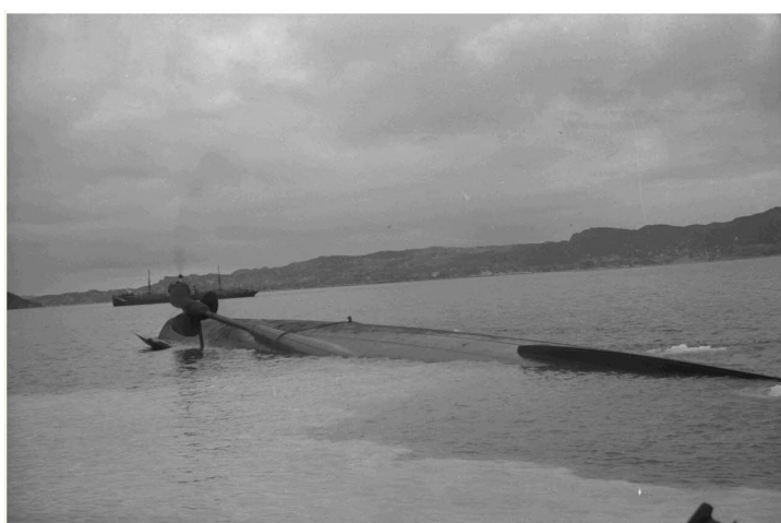
N° 11/ Référence : DAM 45 L12

A Bergen, le croiseur léger Königsberg commandé par le capitaine (Kapitän zur See) Heinrich Rufus est coulé par une attaque de la Royal Air Force.