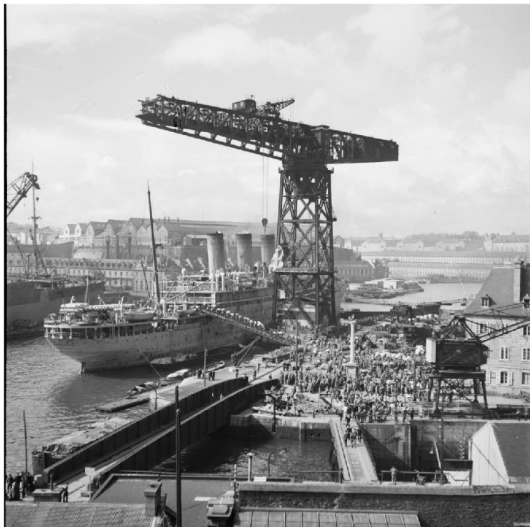
N° 4/ Référence : MARINE 222-3101

L'embarquement des unités franco-polonaises pour la Norvège débute le 12 avril 1940 depuis le port de Brest. La 1 re DLCh et les éléments organiques du CEFS sont répartis en cinq convois principaux dont le départ du port breton s'échelonne entre le 12 et le 23 avril 1940. Ceux-ci font escale en Ecosse (Greenock ou Scapa Flow) avant de gagner la Norvège.