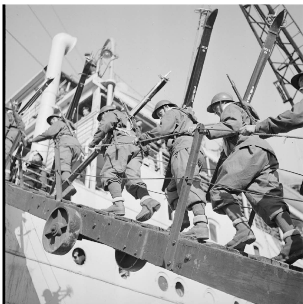
N° 5/ Référence : MARINE 222-3111

Le premier convoi emmenant les troupes franco-polonaises appareille le 12 avril de Brest et lève l'ancre le 16 avril 1940 de Greenock (Ecosse) à destination de Namsos (Norvège). Il se compose des quatre croiseurs auxiliaires de la division du contre-amiral Cadart, « El Djezaïr », « El Mansour », « El Kantara » et « Ville d'Oran ». Il transporte notamment l'état-major du CEFS, une partie de l'état-major de la 1 re DLCh et la 5 e Demi-brigade de chasseurs alpins. Le paquebot « Ville d'Alger » rejoint le convoi plus tard. Le croiseur « Émile Bertin » qui doit assurer la protection du convoi, rejoint ce dernier le 18 avril 1940.