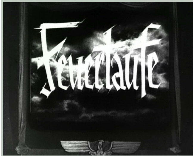
N° 18/ Référence film (photogramme) : SA 12 Time code TC IN : 00 : 03 : 51 A Oslo, présentation à l'ambassade d'Allemagne du film Feuertaufe.