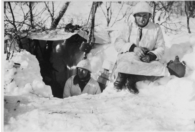
N° 21/ Référence : D233-10-3

Le général Béthouart décide néanmoins de s'emparer de la ville et de poursuivre les Allemands en direction de la frontière suédoise.