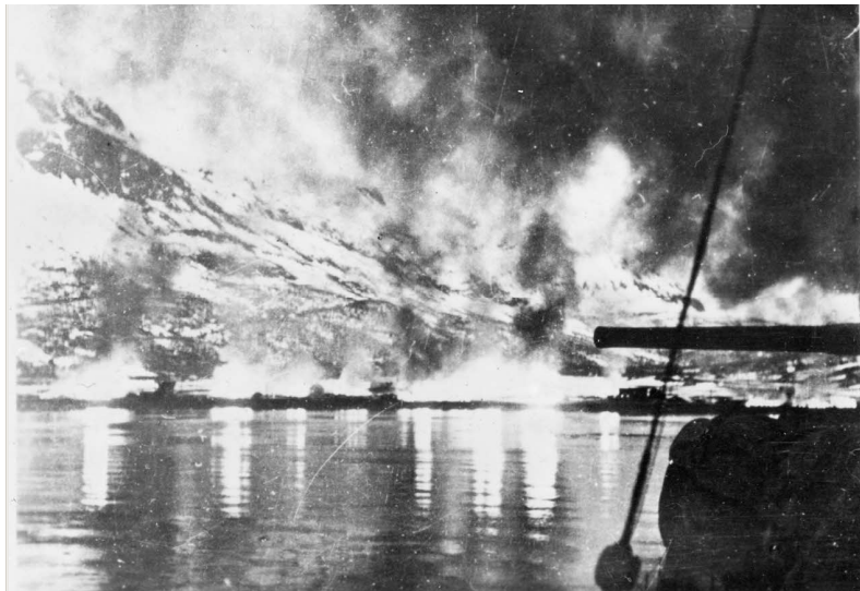
N° 19/ Référence : DG 16-294

Après le revers essuyé à Namsos, le haut-commandement allié veut alors porter l'effort principal sur Narvik. Trois bataillons britanniques débarquent au nord du Lofotenfjord, rejoints par la 27 e Demi-brigade de chasseurs alpins et la 13 e DBMLE. Tandis que chasseurs alpins français et troupes norvégiennes prennent l'offensive au nord de Bjervik, la 13 e DBMLE et les chars Hotchkiss de la 342 e CACC débarquent sous le feu ennemi et s'emparent de la ville le 13 mai 1940.