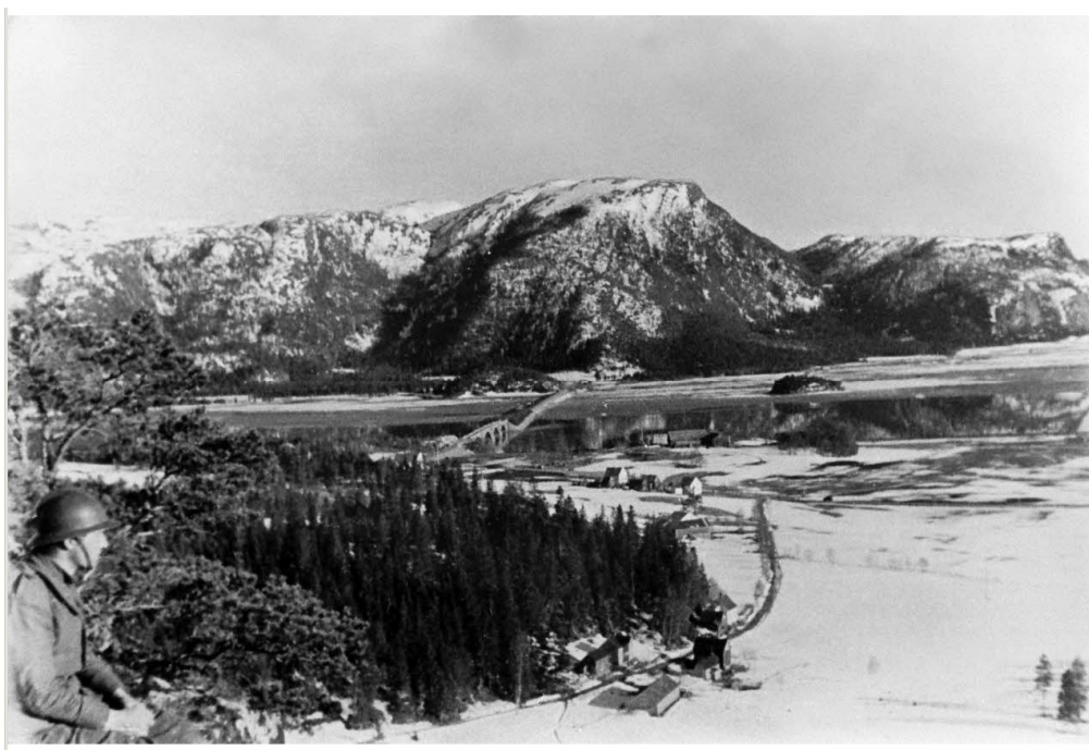
N° 11/ Référence : D25-01-45

Dans la nuit du 2 au 3 mai 1940, les éléments français et anglais rembarquent à bord de plusieurs navires, le croiseur anglais York , des contre-torpilleurs et les trois croiseurs auxiliaires français « El Djezaïr », « El Mansour » et « El Kantara ». Attaqué par l'aviation ennemie, le convoi perd deux contre-torpilleurs, le « Bison » (français) et l' Afridi (anglais), avant d'arriver, le 5 mai, à Scapa Flow (Iles Orcades, Ecosse).