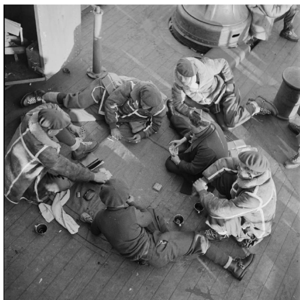
N° 10/ Référence : MARINE 276-3810 Légionnaires de la 13 e DBMLE sur le pont du paquebot « Ville d'Alger » lors de la traversée en direction de Namsos (Norvège). Début mai 1940, photographe Montereau