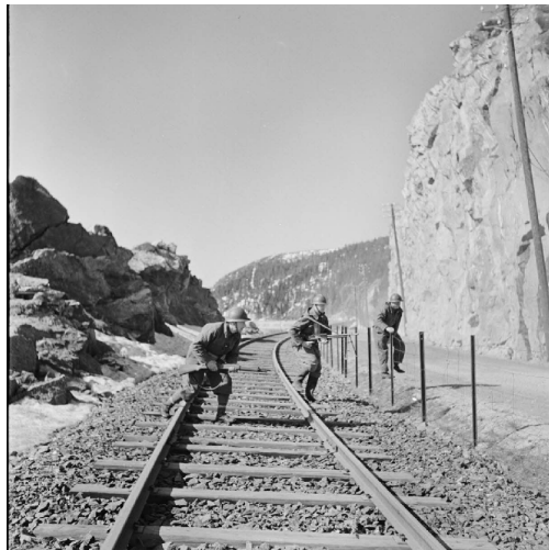
N° 2/ Référence : MARINE 260-3634

Cette expédition est placée sous le commandement britannique et la participation française consiste en l'envoi du CEFS placé sous les ordres du général de division Audet. Le noyau est formé d'une brigade de chasseurs alpins, commandée par le général de brigade Béthouart. Cette brigade est renforcée notamment par les légionnaires de la 13 e DBMLE (Demi-brigade de marche de la Légion étrangère) - future 13 e DBLE en juillet 1940 - du lieutenant-colonel Magrin-Vernerey et par une brigade polonaise.