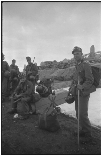
N° 15/ Référence : DAM 94 L23

Après la prise des îles Lofoten, les chasseurs alpins qui y avaient été parachutés rejoignent le continent à bord de train. En arrière-plan le monument aux morts de Lofotbanen.