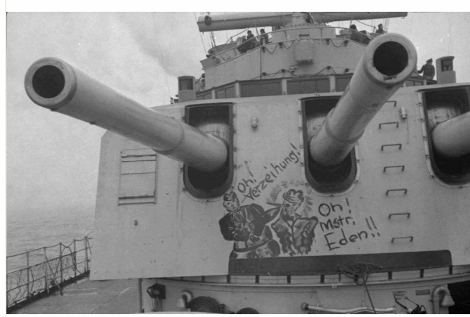
N° 2/ Référence : DAM 49 L12

Sur la tourelle Anton du croiseur allemand Köln, les graffiti présentent un marin allemand bousculant le ministre britannique des Affaires étrangères Anthony Eden en ajoutant "Oh, pardon Mr Eden".