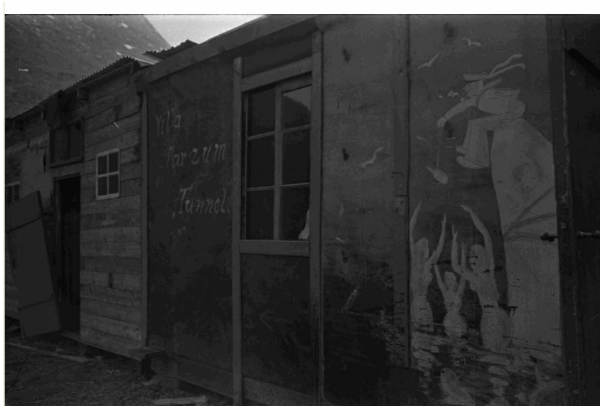
N° 17/ Référence : DAM 91 L02

Le long de la voie ferrée Narvik-Lulea, à proximité de Bornfjell, les baraquements occupés par les soldats du 1 er régiment de chasseurs parachutistes.