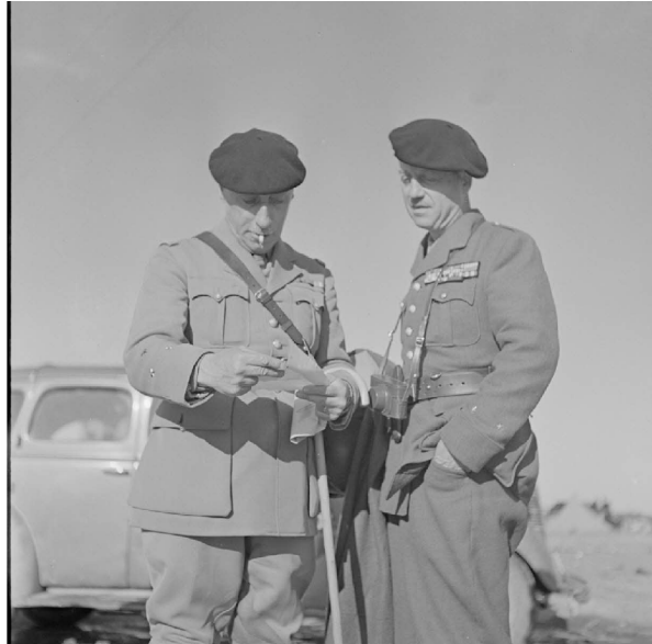
N° 3/ Référence : MARINE 241-3357

affectés au transport de troupes, matériels et ravitaillement, Ville d'Alger, Djenné, Flandre, Président Doumer, Chenonceaux, Mexique, Colombie, Amiénois, Saumur, Cap Blanc, Château Pavie, Saint Firmin, Brestois, Albert Leborgne, Paul Émile Javary, Saint Clair, Vulcain, Enseigne de vaisseau Préchac, Général Metzinger et Providence.