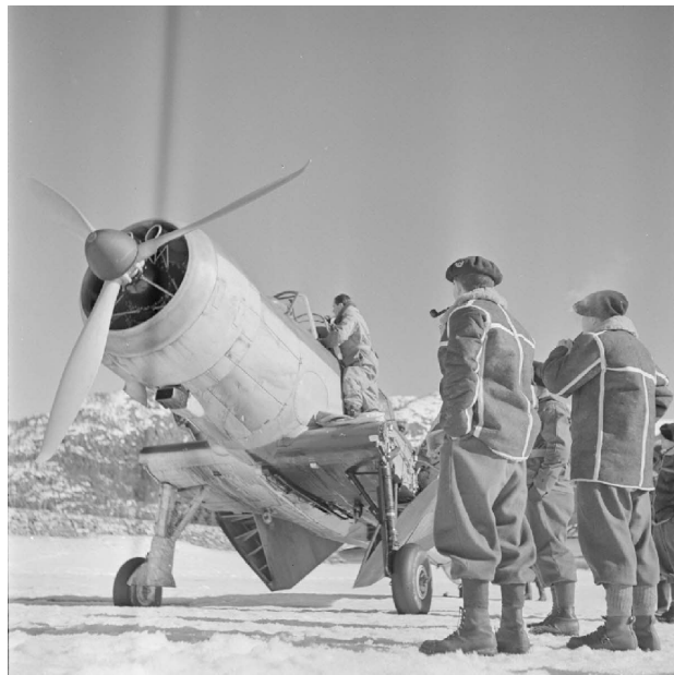
N° 18/ Référence : MARINE 241-3366

Les soldats font probablement partie du détachement sanitaire de l'hôpital installé à Namsos et en particulier des conducteurs de la 271 e Ambulance chirurgicale légère.