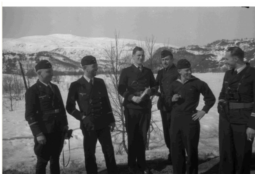
N° 7/ Référence : DAM 46 L06

Dans un premier temps, il s'agit de rendre homogène l'équipement des reporters (appareils de prise de vues, véhicules, armes) souvent très hétéroclite en fonction des compagnies. Durant quatre semaines, afin de rendre les reporters polyvalents, l'accent est mis sur le travail des différentes spécialités des Pk : la photographie, le film, le journalisme, le reportage radio.