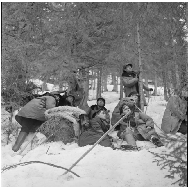
N° 15/ Référence : MARINE 240-3344

Des marins et soldats français subissent une attaque aérienne allemande dans un bois dans le secteur de Namsos (Norvège).